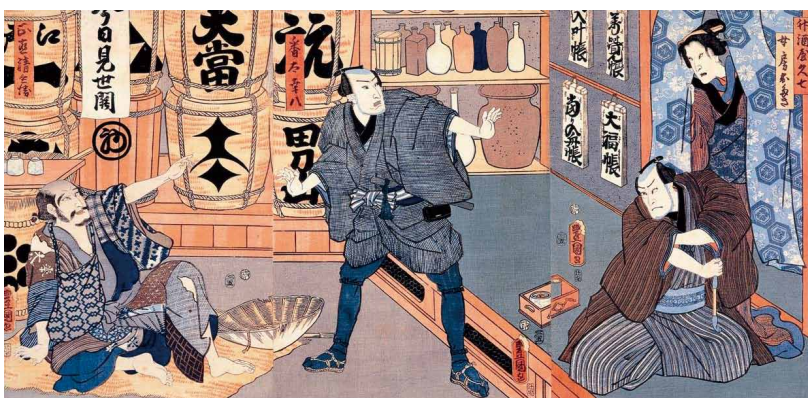
図1 歌舞伎の役者絵 歌川豊国画 マルカン酢(株)所蔵

ある酢酸菌と酢酸発酵に関する科学的な取り組みが盛んに行われるようになりました。主な醸造場から様々な種類の酢酸菌が分離され、お酢の風味の差異は各醸造場に伝わる酢酸菌の違いから生じると考えられるようになりまし