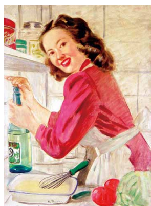
図2 マヨネーズを作る婦人 田村孝之介画 マルカン酢(株)所蔵

明治以降、世界の食が入ってくると、お酢はマヨネーズ、ドレッシング、ピクルスやマリネ、カルパッチョに使用されるなど、用途やスタイルを広げていきました（図2）。現在もお酢の変化は続き、ポン酢ドレッシング、サンラータンスープなど、和食の枠を超えた多様な食文化を生み出しています。