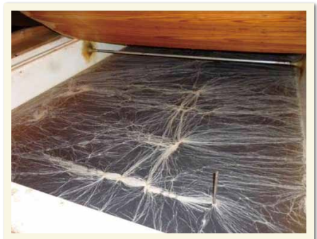
図4 静置発酵の酢酸菌 白く見える薄い菌膜の下で、お酢ができて上がっていきます。

江戸時代から伝わるお酢の製造法が、今も一部の醸造場において、受け継がれています。活発に発酵しているお酢の発酵槽から酢酸菌の菌膜をすくい取り、お酒を適度に希釈したお酢の仕込み液の表面に静かに浮かせます。一週間程度で液面全体が薄い菌膜で蓋われるようになります(図4)。発酵が進むにしたがって、お酢の仕込み液に含まれるお酒のエタノール成分は、酢酸に代わっていき、一か月程度でお酢ができて上がります。これを静置発酵と言います。お酢の生産が企業化され