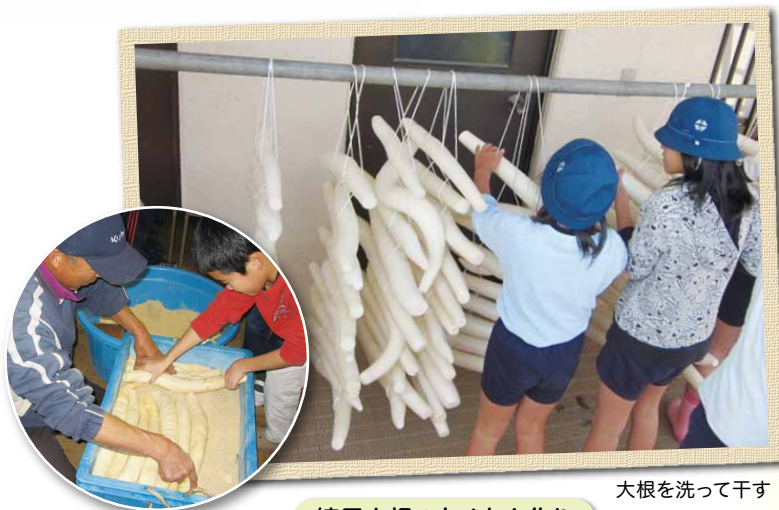
大根を洗って干す