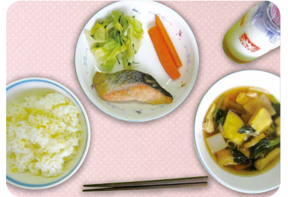
日本型食生活の実践

しながら食べるということなり、1〜6年生まで「旬」という言葉にとっても敏感となった。