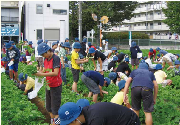
練馬大根のまびき作業

が多くの人によって支えられていることを実感し、命をいただくことに感謝する「いただきます」だけでなく、この食事に関わってくれた全ての人に感謝できるようにしたい。旬の食材に気づくこと、生産体験を通して生産者の苦勞を知ること、料理に多くの人の時間と手間、愛情が詰まっていることなど、その食事の作り手の想いをくみ取ることができるようになってほしいと願っている。